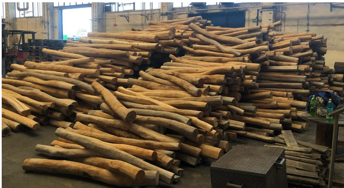
Inspirativní obrázek akátových kůlů.